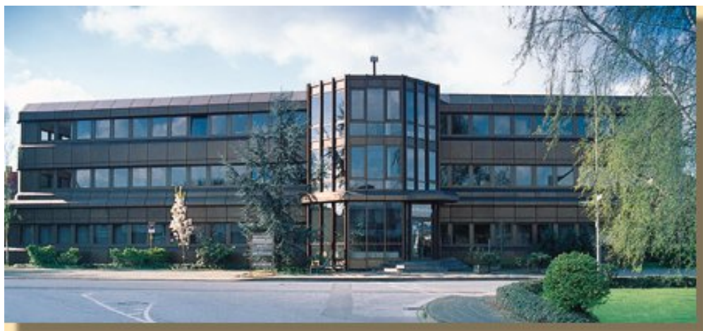
Firmensitz der COMPU-ORGA in Kaarst

Die Rechtevergabe an den Programmen erfolgt über neutrale Profile, die dem Benutzer zugewiesen werden. COMPU-ORGA liefert sinnvolle und bewährte Profile, die vom Kunden geändert oder um weitere ergänzt werden können. Die Profile unterscheiden in Lese-, Neuanlage-, Änderungs- und Löschrechten.